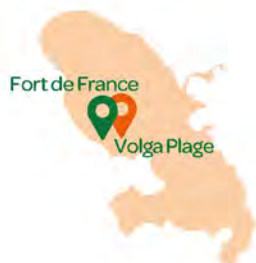
Fort de France