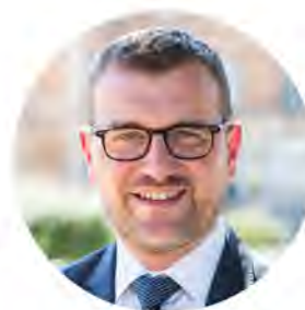
Olivier Klein, Président de l'ANRU