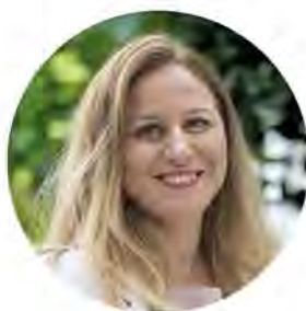
Nadia Hai, Ministre déléguée chargée de la Ville