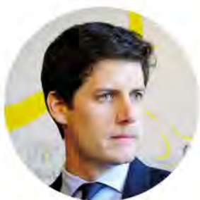
Julien Denormandie, Ministre de l'Agriculture et de l'Alimentation

Bravo aux 48 nouveaux lauréats de cette deuxième tranche, qui ont fait preuve d'innovation et d'ambition dans leurs projets, et rendez-vous à l'été pour la suite... et pour les premières récoltes !