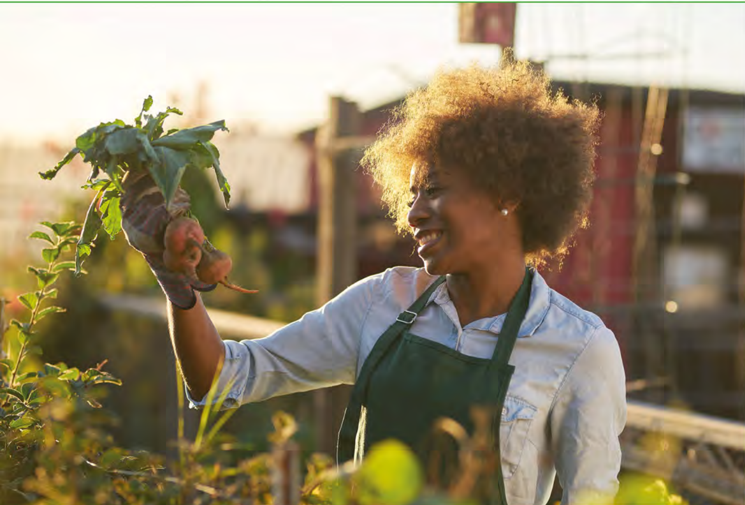
Ces illustrations sont des photos génériques et ne représentent pas un lauréat.