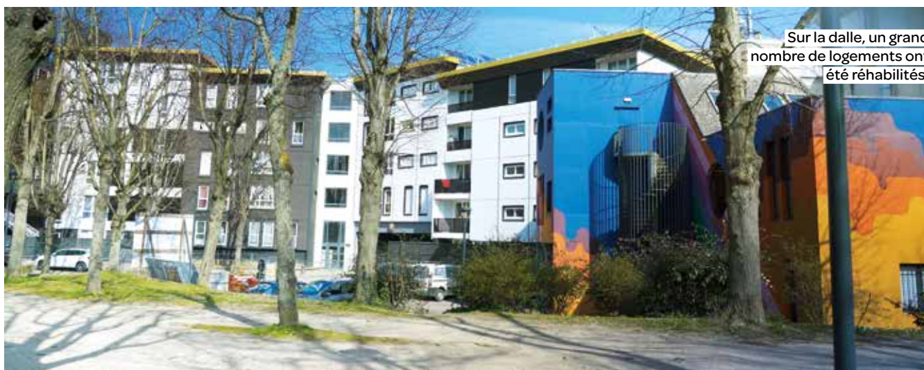
Sur la dalle, un grand nombre de logements ont été réhabilités.