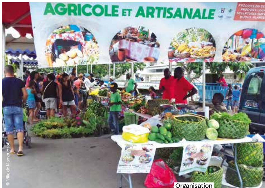
Organisation de la foire agricole dans le quartier de Kaweni, à Mayotte.

Grâce au premier programme de rénovation urbaine (PNRU), un grand nombre de quartiers ont connu un rebond de l'activité économique : création de commerces, de services, d'activités artisanales, installation de professionnels de santé... Dès la préparation des projets, l'ANRU et la Banque des Territoires