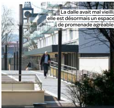
La dalle avait mal vieilli, elle est désormais un espace de promenade agréable.