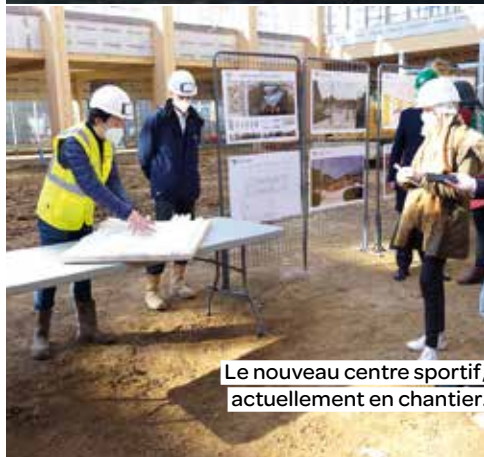
Le nouveau centre sportif, actuellement en chantier.

a débuté en 2020, et qui sera la rotule du nouveau projet de renouvellement urbain. « Il est situé dans le prolongement d'un quartier qui a été refait, le long d'une promenade qui va être aménagée en coulée verte. Il se situe aussi tout près du quartier du Parc, où de nombreux logements seront réhabilités. L'objectif est d'apporter une présence publique, des associations dans le quartier. Et de créer un lieu de convivialité », résume le maire. Au total, 45 opérations sont prévues dans le cadre du NPNRU à Val-de-Reuil qui prévoit notamment la déconstruction de 328 logements et la rénovation de 1400 autres. « Ce nouveau programme est l'aboutissement de ce qu'on a fait ces quinze dernières années. Nous étions dans l'urgence puis dans la relance. Là, nous allons nous assurer que les Rivalois puissent vivre dans de bonnes conditions. » ●