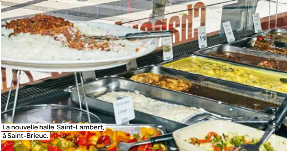
La nouvelle halle Saint-Lambert, à Saint-Brieuc.