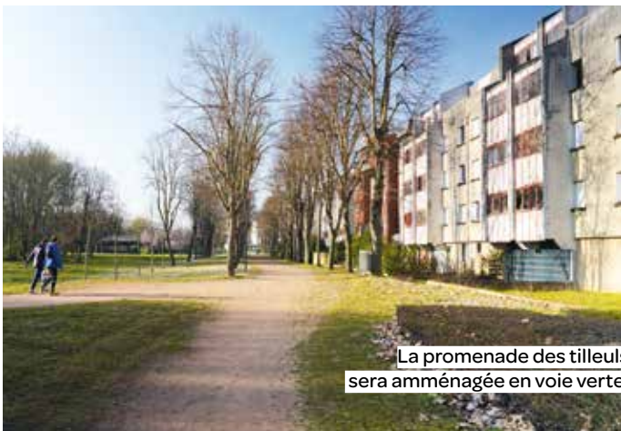
La promenade des tilleuls sera aménagée en voie verte.

« Le centre sportif Léo-Lagrange remplacera un ancien gymnase, vétuste et plus aux normes. Il doit accueillir de grandes compétitions, mais aussi des associations, des enfants. Il se situe de long de la future promenade des Tilleuls, une coulée verte qui sera ponctuée d'équipements publics, pour rejoindre une école qui va être rénovée. Elle ira aussi vers le jardin des Animaux fantastiques, en centre-ville, qui sera lui aussi refait. Nous voulions vraiment intégrer des espaces verts au projet, c'était une demande des habitants. »